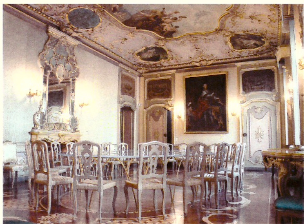
Sala Adunanze Pubbliche Accademia di Agricoltura di Torino

Accademia di Agricoltura via Andrea Doria, 10 - Torino